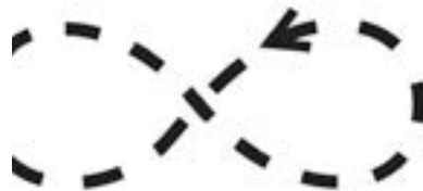
Marche en 8