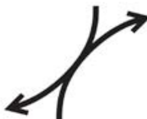
Donner / Recevoir