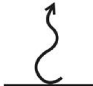
Construire sa verticalité